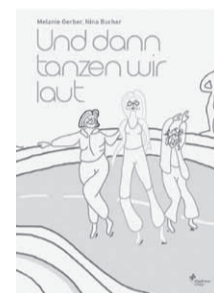
Illustration: Nina Bucher

Alles zum Buch: bestellen, Finale zum Wettbewerb uploaden, e-voten: www.und-dann-tanzen-wir-laut.ch